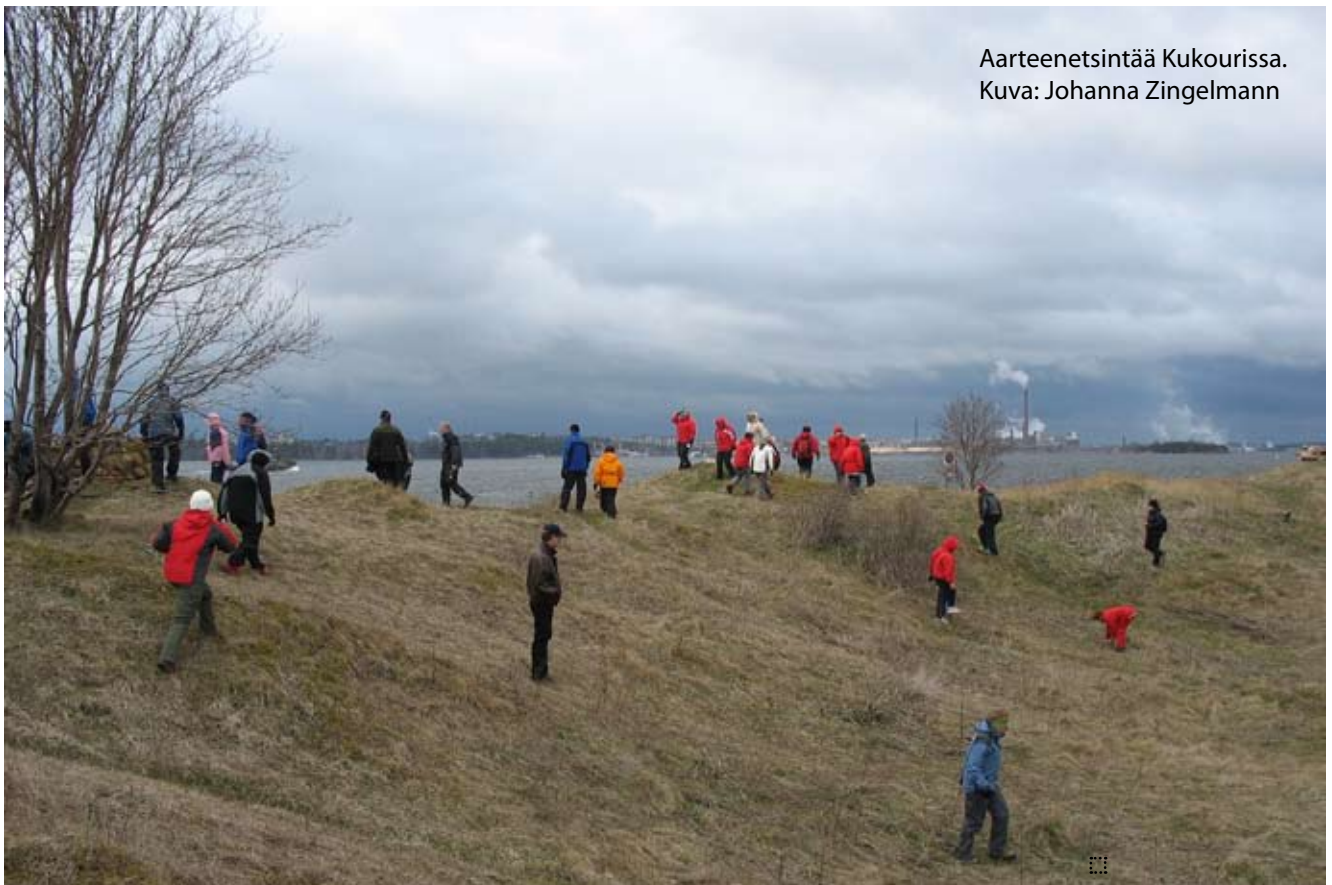
Aartenetsintää Kukourissa.

Järjestön syysliittokokous pidetään aiemmin ilmoitetusta poiketen lokakuun viimeisenä viikonloppuna 27.-28.10. Lounais-Suomen latualueella. Strategiatyöskentely on silloin valmis.